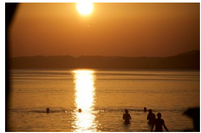
Sonnenuntergang am Chiemsee - einzigartig und magisch