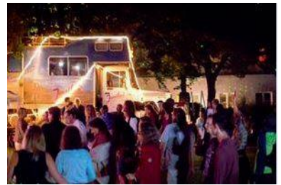
Mit dem Jonathan "Nasenbär" unterwegs auf Festivals