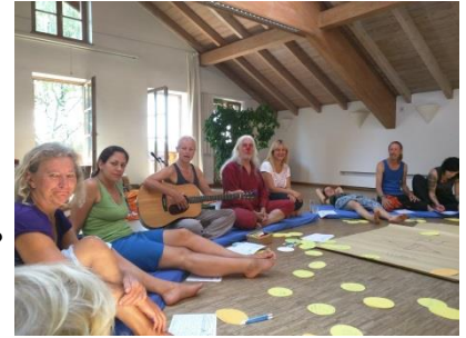
Gemeinsam Themen untersuchen und erforschen

Preise und Anmeldeformular findest du hier .