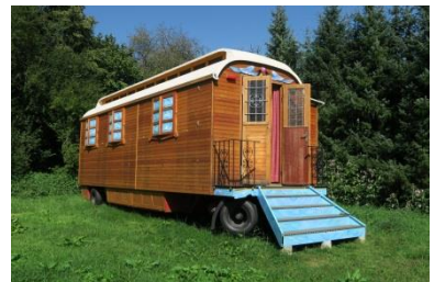
"Sweet Home" - unser Neuzuwachs für ein ganz neues Übernachtungserlebnis