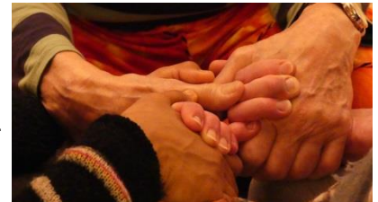
"Berührungsräume" beim Schöpfer-Seminar